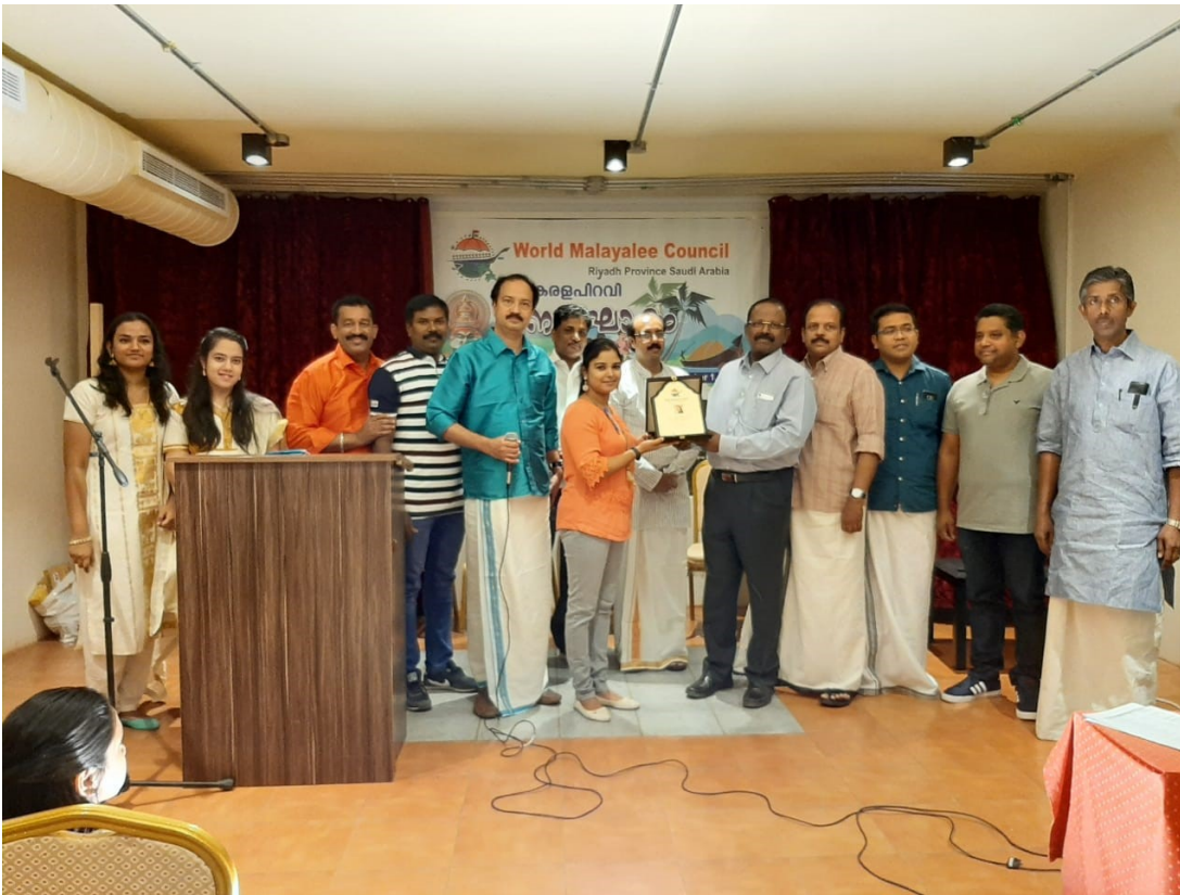
Riyadh Province, Saudi Arabia celebrated Kerala Piravi in a grand scale on November 1, 2019